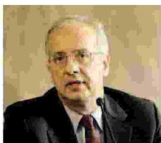
VELTRONI L'ex segretario del Pd terrà per la Holden una lezione in streaming

LA NUOVA SEDE L'ex caserma Cavalli che, in piazza Borgo Dora, ospita da un anno la nuova sede della Scuola Holden