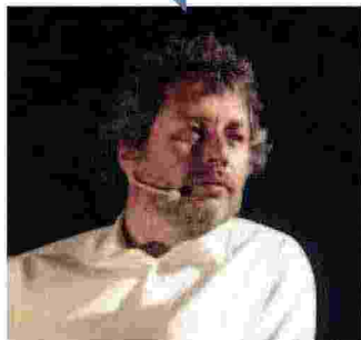
BARICCO Alessandro Baricco è fondatore e "anima" della Scuola Holden