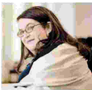
ALDERMAN Tra gli ospiti la scrittrice britannica autrice della app per iPhone "Zombies, run!"