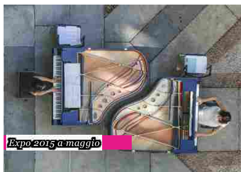
Expo 2015 a maggio